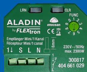
ALADIN Empfänger Mini, 230 V, 1 Kanal, UP Art.Nr.: 300817 E-Nr.: 404 661 029